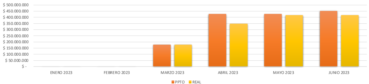
INGRESOS ACUMULADOS A JUNIO 2023